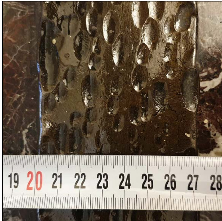
Снимка 1 съществуващо положение