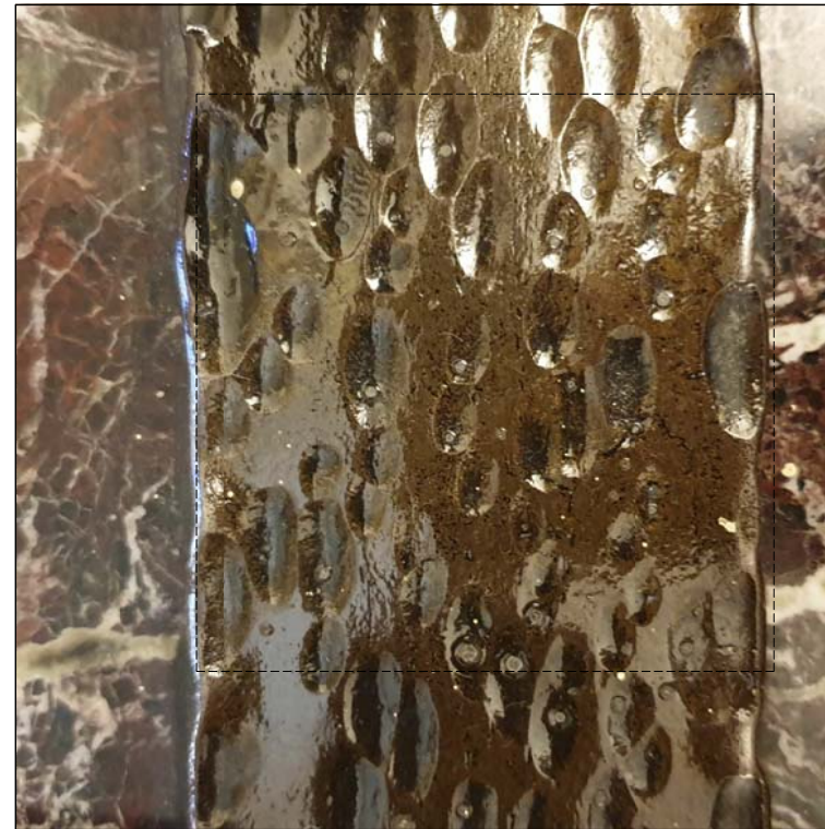
Снимка 2 съществуващо положение